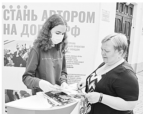
Не знаешь, какие поправки предлагаются внести в Конституцию — спроси у волонтера!

В НАШЕМ ГОРОДЕ развернулось пять информационных пунктов, где волонтеры Конституции рассказывают жителям о предлагаемых поправках в Основной закон государства и о том, как, где и когда можно проголосовать.