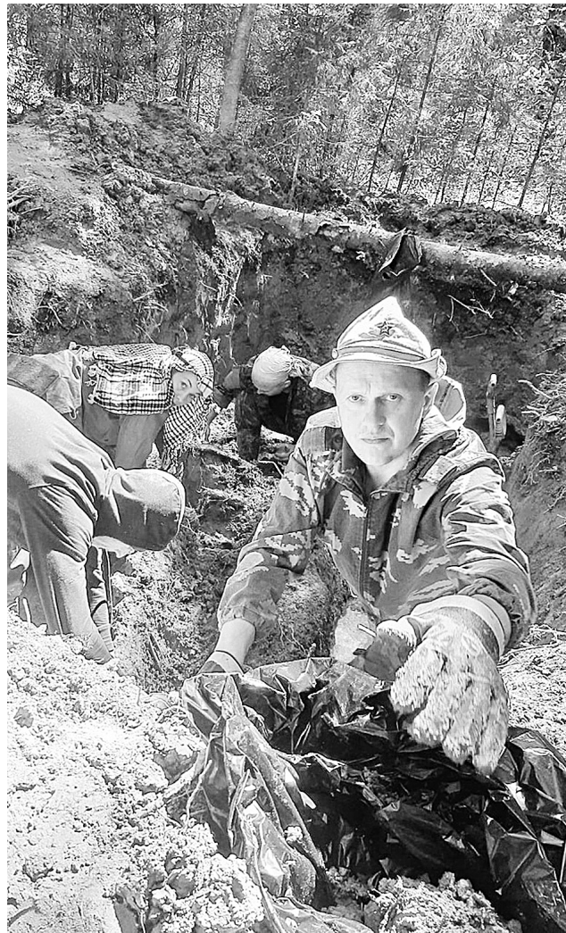
Полевой выезд поисковиков в Любытинский район

ПОИСКОВЫЙ отряд «Звезда» вновь стал победителем конкурса Фонда президентских грантов. Почти 1 миллион 400 тысяч рублей получит отряд на подготовку и проведение поисковых экспедиций и патриотическую работу с молодёжью.